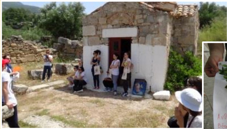
«Μύθοι και φυσικό περιβάλλον της περιοχής», Α.Τσίγκου