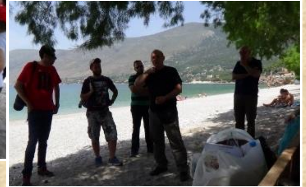
«Θαλάσσιο και γεωλογικό περιβάλλον», Δ.Οικονόμου, Ν.Γαλανοπούλου, Δ.Θεοχάρης